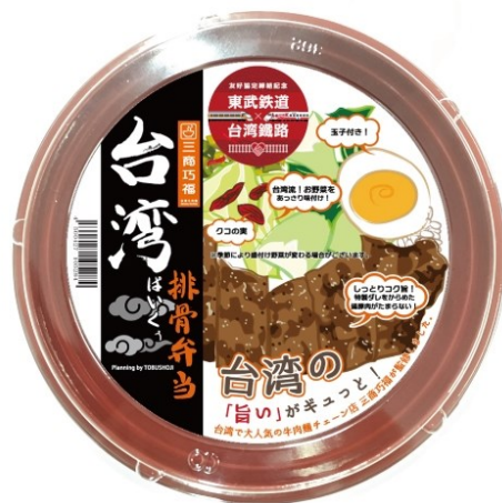
△台湾排骨弁当（イメージ）

このリリースのお問い合わせは、東武商事(株)営業開発部 TEL03-3623-4061